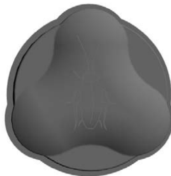
Рисунок 2. Крышка, вид сверху