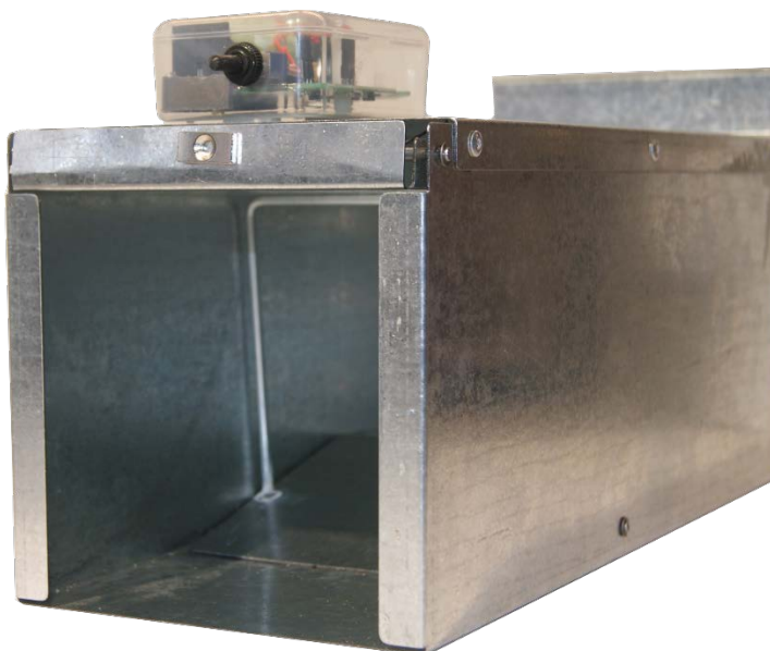
Модель ЖКТ-2 ЖКТ-2СС